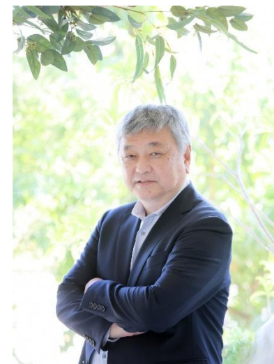
オール日本スーパーマーケット協会 会長

「教育」「商品」「情報」の3つの側面から会員企業をサポートすることによって、会員企業が繁栄し、ひいてはスーパーマーケット業界全体が発展するよう各活動を活発に展開して参ります。