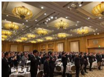
新年互例会 (毎年1月)