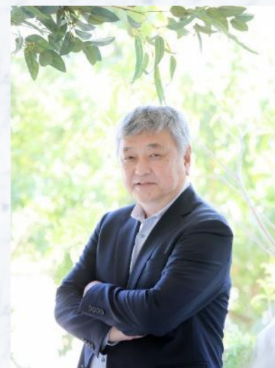
オール日本スーパーマーケット協会 会長

「教育」「商品」「情報」の3つの側面から会員企業をサポートすることによって、会員企業が繁栄し、ひいてはスーパーマーケット業界全体が発展するよう各活動を活発に展開して参ります。