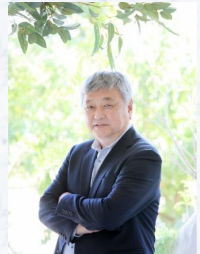
コプロ株式会社 代表取締役社長

スーパーマーケットは地域の生活者にとって欠かせない社会的インフラとして重要な役割があります。当社は使命である「AJS会員企業の繁栄に貢献する」を実現し、地域の生活者を支えるAJS会員企業をバックアップしていきたいと考えています。