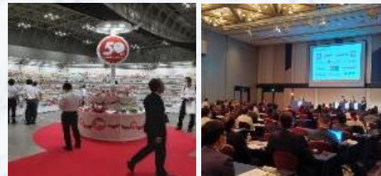
商品・用度展示会 & スーパーマーケット・フェスティバル (毎年8月)