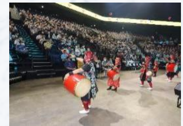
記念大会 (周年行事)